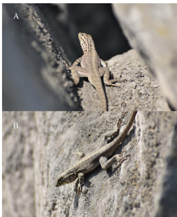
Figura 3. Microlophus tigris macho subadulto en dos ángulos distintos (A, B).