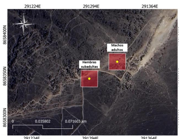
Figura 6. Distancia geográfica entre machos adultos y hembras subadultas de Microlophus tigris .