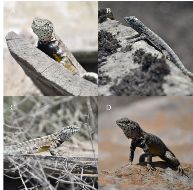
Figura 2. Microlophus tigris macho adulto en diversos ángulos (A, B, C, D).

estructura social. Adicionalmente, se observó una prevalencia de machos en comparación con las hembras, señalando una posible disparidad en la proporción de sexos en la población de M. tigris en el Parque Ecológico de La Molina.