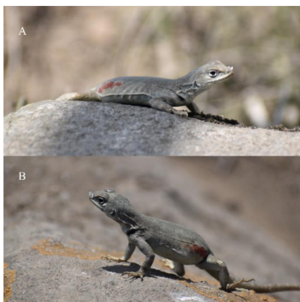
Figura 4. Microlophus tigris hembra subadulta en dos ángulos distintos (A, B).