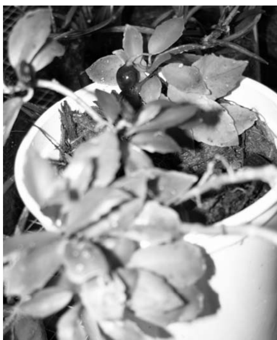
Figura 6: Codonanthe uleana Fritsch en cultivo.