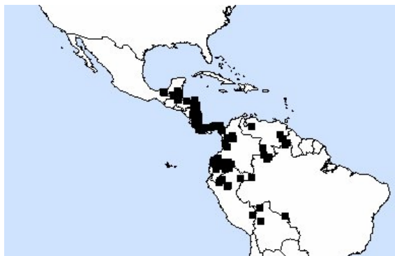
Figura 2: Mapa de puntos de colecta para especímenes de Codonanthe crassifolia (H. Focke) C.V. Morton.

Se adapta muy bien al cultivo y al clima de Lima, de modo que después de un tiempo de adecuación al cultivo ya no es necesario seguir protegiendo las plantas por las noches con el túnel. Como su aspecto vegetativo, sus flores y frutos son muy atractivos podría considerarse como un potencial recurso ornamental (Figura 3).