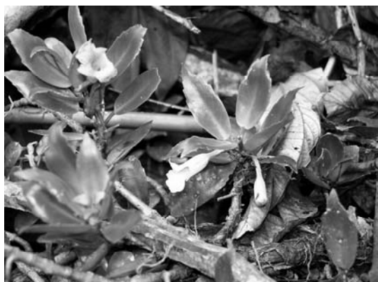
Figura 5: Codonanthe uleana Fritsch en hábitat (foto Michael S. Vega).

Para su cultivo es recomendable mantener a la planta siempre en lugar abrigado para garantizar su crecimiento (Figura 6). Justamente gracias a esto fue posible notar que los dos morfotipos descritos en el párrafo anterior eran de la misma especie.