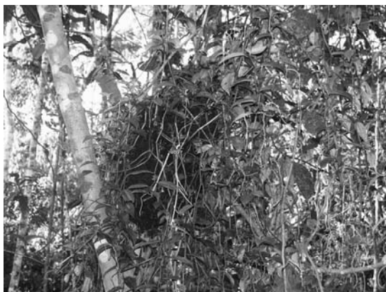
Figura 7: Jardín de Hormigas de las especies Camponotus femoratus y Crematogaster cf. limanata parabiótica en un bosque de terraza.