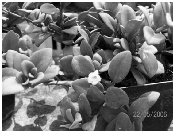
Figura 3: Codonanthe crassifolia (H. Focke) C.V. Morton en cultivo.

Madre de Dios, salvo el voucher M. A. Chocce 428 en el BRIT, pero que no fue determinado como C. crassifolia , por lo que este sería el primer reporte para la flora de Madre de Dios, ampliando su distribución.