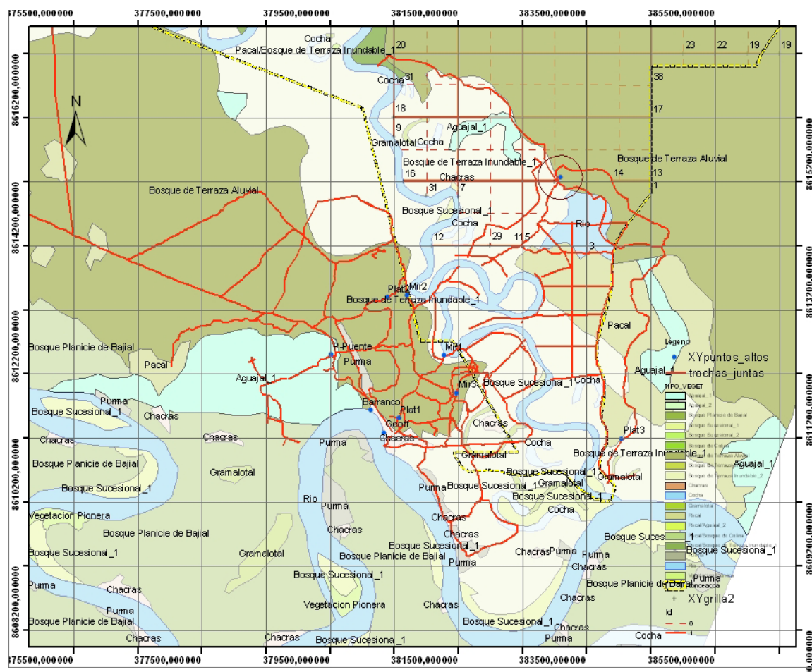
Figura 1: Mapa de ubicación de la zona de estudio, mostrando las principales formaciones vegetales y el actual sistema de trochas de la estación experimental CICRA (cortesía de la WWF).

Para las determinaciones taxonómicas, se recurrió al uso de claves como las publicadas por Skog & Kvist (1997) y Vásquez (1997). Así mismo, se compararon las muestras con otras colecciones depositadas en el herbario MOL de la Universidad Nacional Agraria La Molina y en el herbario USM de la Universidad Nacional Mayor de San Marcos. Además se visitó los sites de “W3 TROPICOS” de Missouri Botanical Garden (2006) y “ATRIUM” del Botanical Research Institute of Texas (2005) donde se hizo uso de la base de datos y una galería fotográfica disponibles.