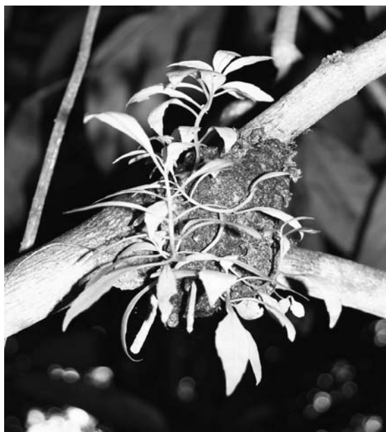
Figura 8: Codonanthe uleana Fritsch en jardín de Azteca sp. en el bosque de terraza.