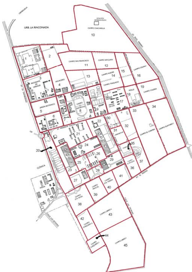
Anexo. Mapa de la Universidad Nacional Agraria La Molina Lima, Perú