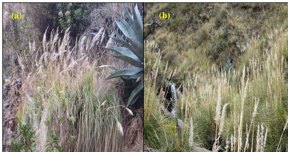
Figura 2. (a) Cortaderia hieronymi N.P. Barker & H. P. Linder, sector Llajuapampa. (b) Cortaderia jubata (Lemoine) Stapf, sector carretera a Carhuapata a 4.8 km de la capital del distrito de Lircay.