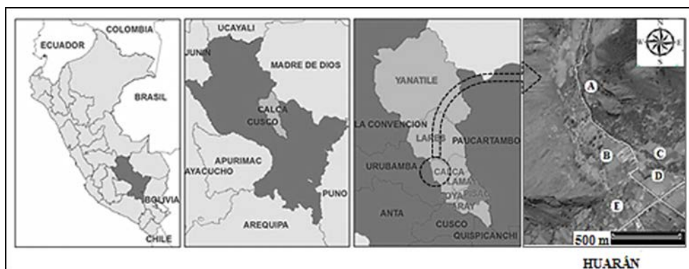
Figura 1. Mapa de ubicación geográfica y política de la localidad de Huarán. A, B, C, D y E: ubicación de los apiarios.

Las mieles estudiadas correspondieron a la temporada apícola 2012 – 2013, en la que se definieron cinco periodos bimestrales de producción: periodo I (julio-agosto 2012), periodo II (setiembre-octubre 2012), periodo III (noviembre-diciembre 2012), periodo IV (enero-febrero 2013) y periodo V (marzo-abril 2013). Se colocaron en cada una de las colmenas seleccionadas, entre 1 y 5 marcos de madera debidamente rotulados al inicio de cada periodo de producción, estos fueron extraídos y reemplazados al final de dichos periodos; se procuró que por lo menos unas \frac{3}{4} partes del panal construido estuviera