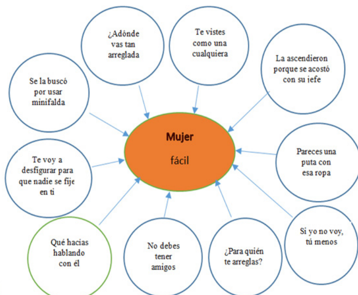
Constelación 4 - Expresiones cotidianas – Mujer – fácil