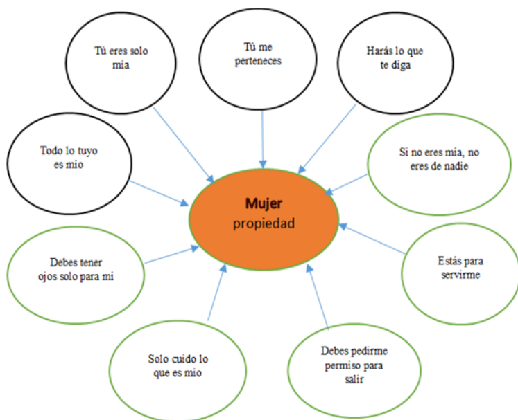
Constelación 2. Expresiones cotidianas – Mujer -propiedad

Otra forma de atacar a la mujer es tildándola de mujerzuela, coqueta, fácil. Por tanto, siendo de “cascos ligeros” no merece ser respetada y como consecuencia lógica, él tiene todo el derecho para insultarla, gritarle y golpearla; de este modo justifica sus agresiones, ya que tiene que enderezarla. Él la ha concientizado de que todo es su culpa.