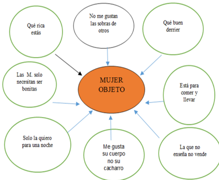
Constelación 1. Expresiones cotidianas – Mujer - objeto

Se siente el rey de la manada, él fija las normas que deben cumplirse, pero para eso va aniquilando poco a poco la autoestima de la mujer, haciéndole creer que no vale nada. Esta es una tarea del día a día, que la va minando. La minimiza con las acciones, con palabras, con golpes y hasta quitándole la vida.